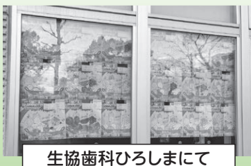
生協歯科ひろしまにて