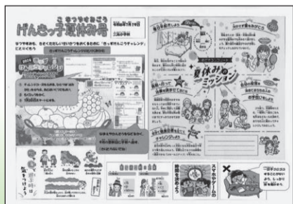
ほけんだより「げんきっ子」できずけんこうチャレンジを紹介しています

前任の養護教諭の先生が取り組まれていたので、引継ぎの際にこういう取り組みがあると知りました。前年度初めて取り組んで、今年度で2回目になります。毎年夏休みに「はみがきカレンダー」を出していたので、けんこうチャレンジのキッズパンフレットを、夏休みの「はみがきカレンダー」として活用しています。取り組み方については、今年度は夏休み前の終業式で児童に説明しました。(夏休み前のほけんだよりでも紹介しました。)