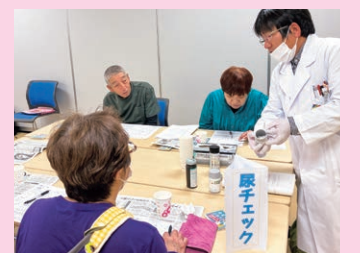
10月31日(木)生協けんこうプラザ

10月15日(火)生協さえき病院、10月31日(木)生協けんこうプラザにて「健康チェックサポーター養成講座」を開催しました。講座の前半は看護師、検査技師、リハビリスタッフからチェックメニューの講義があり、後半は健康チェックの実践でした。マンシエットの巻き方など看護師さんから指導を受けながらお互いに血圧測定。体脂肪チェック、握力チェック、足指力チェックと続き、最後は尿チェック。尿塩分チェック