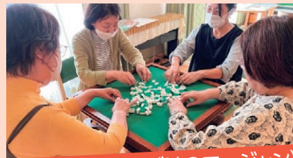
ペンギん班(女性だけのマーじゃん)