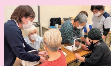
10月15日(火)生協さえき病院

では、塩分摂取量が少ない人の結果を見て「うらやましい〜」「レシピを教えて欲しいわ〜」など健康チェック結果から話が弾みます。