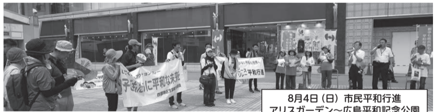
8月4日(日) 市民平和行進 アリスガーデン～広島平和記念公園