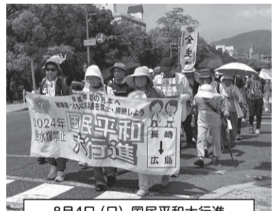
8月4日(日) 国民平和行進 庚午第一公園～広島平和記念公園