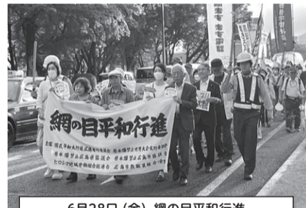
6月28日(金) 網の目平和行進 旧福島生協病院跡地前～広島平和記念公園

8・6平和運動の取り組みの一環として、様々な平和行進が実施されており、当生協も参加しました。どの行進も天気に恵まれ、暑い中での行進は大変でしたが、多くの団体と共に平和と原水爆禁止・核兵器廃絶への願いをアピールできたのではないかと思います。