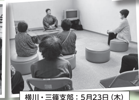
横川・三篠支部：5月23日(木)