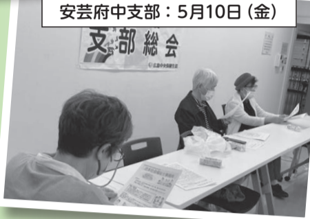
安芸府中支部: 5月10日 (金)