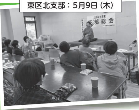
東区北支部: 5月9日 (木)

した組合員さんも 考えさせられ、学 びのある学習会 となりました。 失って初めてわ かる健康のあり がたさをしみじ みと感じ、病んだ 時は助け合える 社会にしていけ ないと思えます。