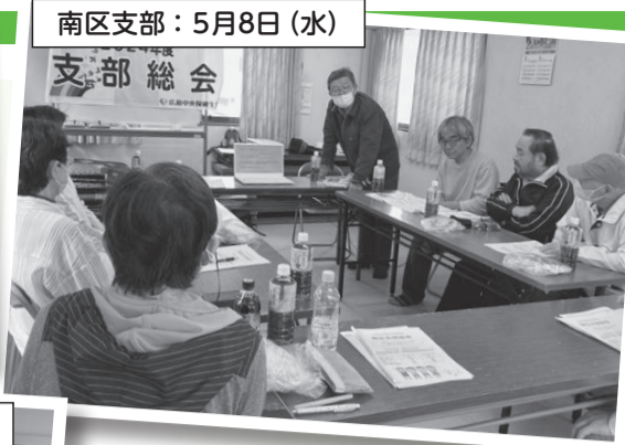
南区支部: 5月8日 (水)