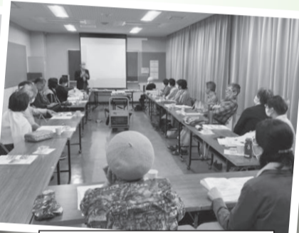
廿日市支部：5月15日(水)