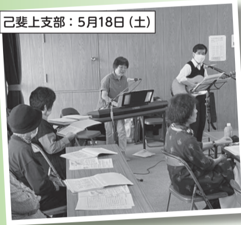
己斐上支部：5月18日(土)

こうやって、集うこと・しゃべること・歌って健康で過ごしていく!これこそが医療福祉生協の魅力と感じました。