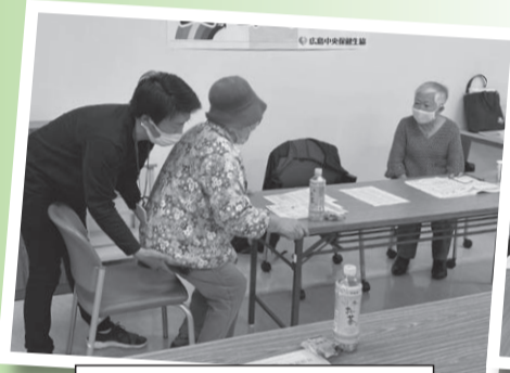
八幡東支部：5月8日(水)