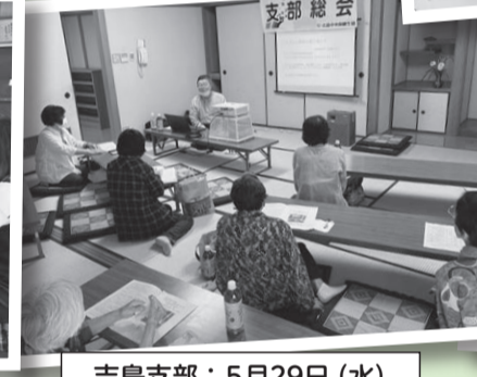
吉島支部: 5月29日 (水)