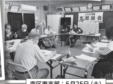
南区東支部: 5月25日 (土)