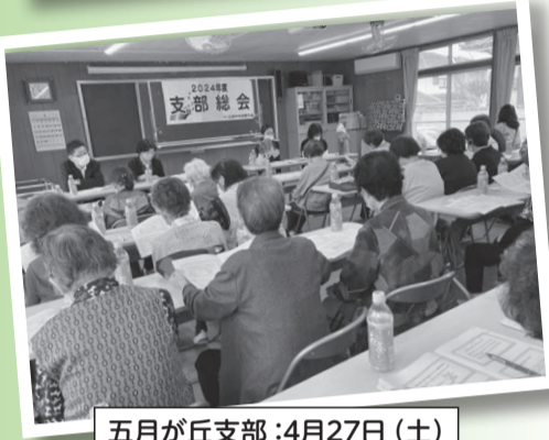
五月が丘支部：4月27日(土)