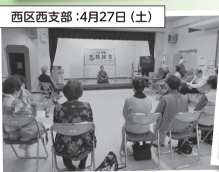
西区西支部：4月27日(土)