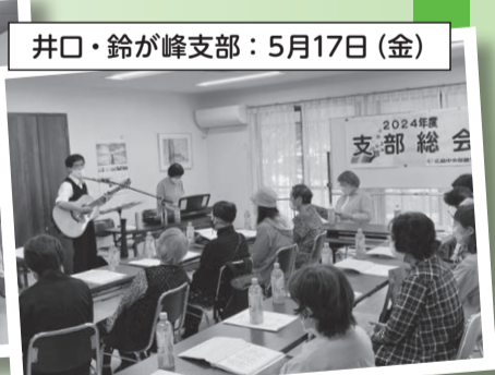
井口・鈴が峰支部：5月17日(金)