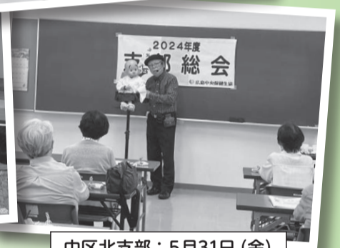
中区北支部: 5月31日 (金)