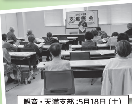
観音・天満支部：5月18日(土)