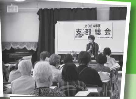
五日市支部：5月31日(金)