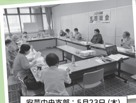
安芸中央支部: 5月23日 (木)