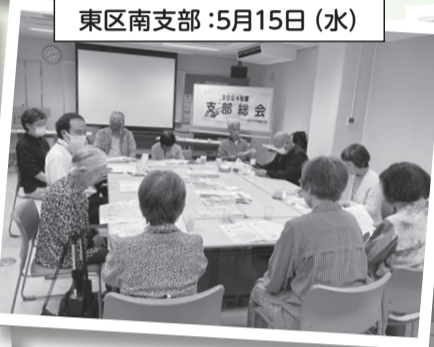
東区南支部: 5月15日 (水)