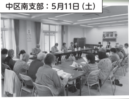
中区南支部: 5月11日 (土)