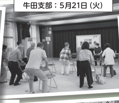
牛田支部: 5月21日 (火)