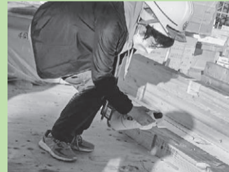
お清めの儀(おきよめのぎ)