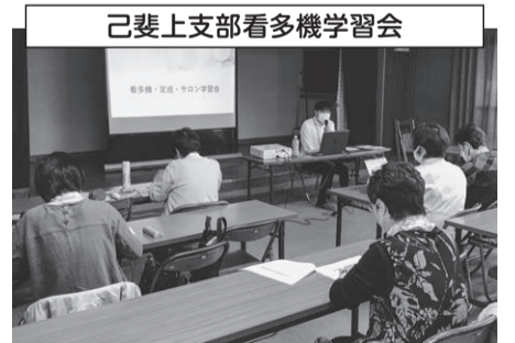
己斐上支部看多機学習会