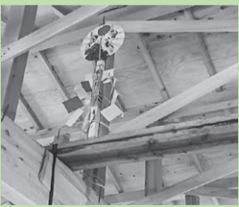
上棟式(じょうとうしき)

建設現場の様子をお届けします! 「あんしんセンターコープ五日市」の建設 地で12月13日にお清めの儀、12月21日に 上棟式が執り行われました。