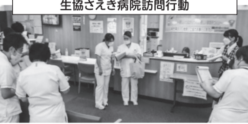
生協さえき病院訪問行動

地域支部では、訪問行動を通じての名義変更などで仲間ふやしがすすみました。また、これまでの班会やバスハイクといった支部のイベントに参加された方々とのつながりを活かした仲間ふやしや