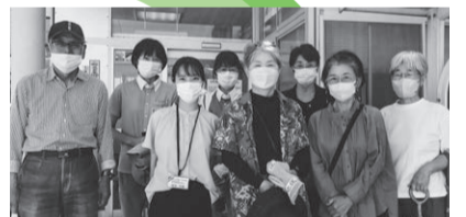
9/29 西区西支部 草津南を訪問 増資1件