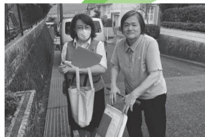
9/26 美鈴が丘支部 美鈴が丘南訪問 班会・学習会などの活動拡大に向けて組合員さん訪問