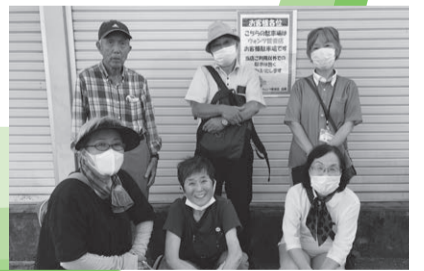
9/29 観音・天満支部 南観音を訪問 担い手1名