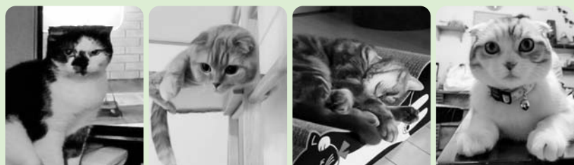
11歳 ツナ 7歳 雫 5歳 凜 1歳 桃

犬好きから一転猫好きに。今や4匹になってしまいました。スコティッシュフォールドという種類ですが、もの静かでもとても飼いやすい猫ちゃんです。(投稿者:Hさん)