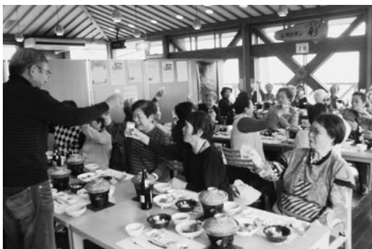
バスバイクでも多くの増資がありました

9月25日から始めた生協強化月間は、11月末までに372名の組合員加入（昨年より22名増）と3,000万円の出資金増やしを進め、終了となりました。みなさん大変お疲れ様でした。支部・職場ごとのスタート集会、田代病院長の健康づくり講座や熊本震災支援報告、支部での活動報告と豊かな内容でキックオフ集会を開催し、医療福祉生協の魅力が再認識するところから月間がスタートしました。