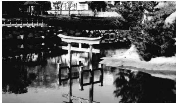
昔は港の一部だったが今は池になって残っている。池には鳥居が立っている。