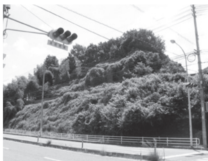
こちらの小高い丘が有井城跡になります。

●有井城跡と土井屋敷跡の石垣 (佐伯区石内南1丁目) 五月ヶ丘団地を降りて石内バイパスを約2km五日市の方向へ進み、「本居橋東」の信号のところには有井城跡の表示木柱が立っています。進行方向の左側の表示木柱がなければこれが城跡と