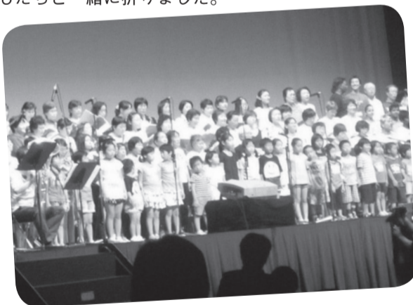
虹のひろばのフィナーレでは、子どもたちと 一緒に「ぞうれっしゃがやってきた」の大合唱。