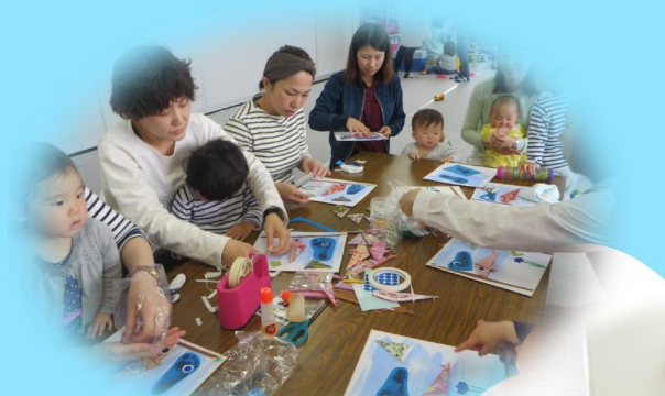
足型を使ってこいのぼり工作中