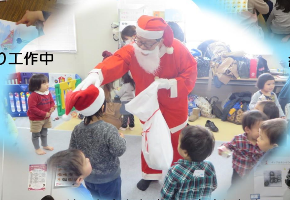
サンタさんもやってきました!