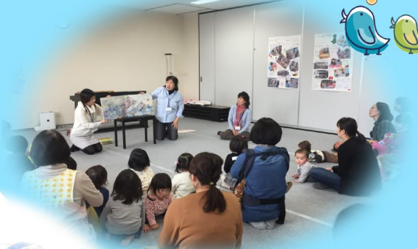
絵本の読み聞かせ