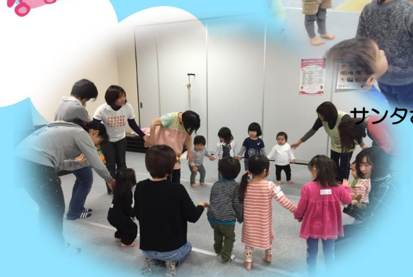
英語を使ったリズム遊び