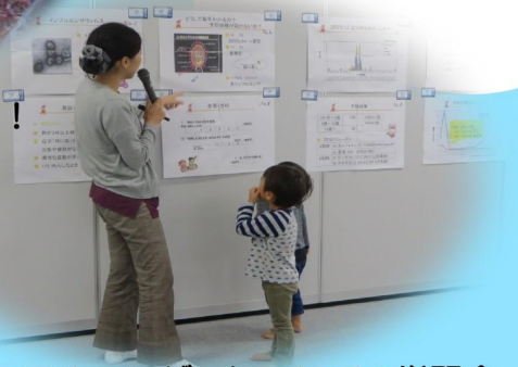
「インフルエンザ」についての学習会