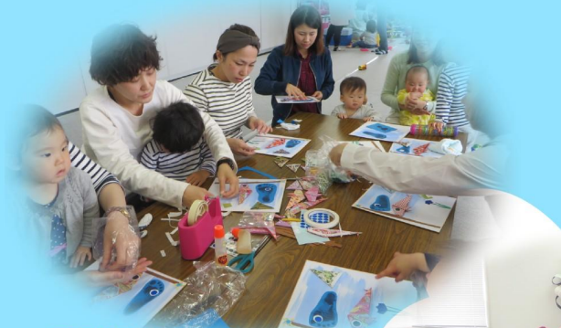
足型を使ってこいのぼり工作中

子育て広場「コープのびのびクラブ」には、多くの親子が遊びに来てくださっています。30分程度のミニ講座（詳しくは裏面）の開催や、保育士も常駐しているので子育ての悩みや不安も相談することができます。是非、お気軽にお越しください。