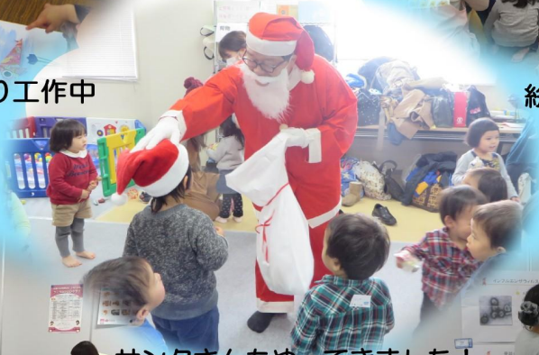
サンタさんもやってきました!