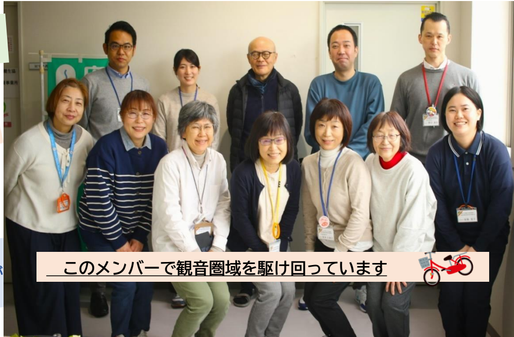
このメンバーで観音圏域を駆け回っています