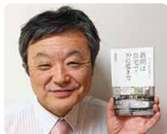
本年1月 院長の本が出版されました。光文社新書です。

在宅患者さんに限ったことではありませんが、高齢者は容体が急変することは珍しくありません。病院のバックアップがあってこそ安心して在宅生活が続けられます。福島生協病院は急な依頼にもいつも対応していただき、とても感謝しております。この場をおかりしまして、厚く御礼申し上げます。