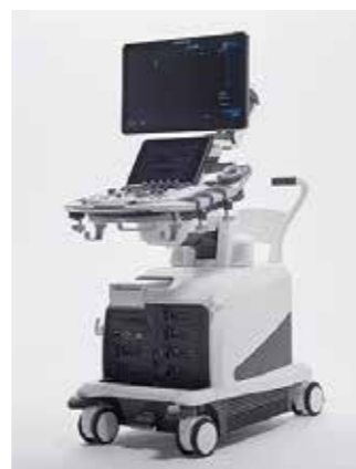
超音波診断装置 FUJIFILM ARIETTA850