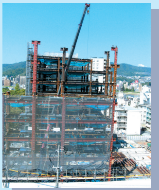
9月5日現在の 建設状況 ▶

来年9月には、福島生協病院が新築移転しオープンを予定しています。新病院の建設は、組合員や病院をご利用いただくみなさんと職員の知恵やご意見を活かして進んでいます。新病院の外観はデザインコンテストで決まりました。内観バースはみなさんの意見を参考にしています。「もしもプロジェクト」というイベントに参加していただくことで、見える病院づくりを感じてください。これからの企画は、待合の椅子やモデルルーム見学などを提案していこうと考えています。人と人をつなぎ地域医療をつなぐ病院づくりに、みなさんのご参加をお待ちしています。