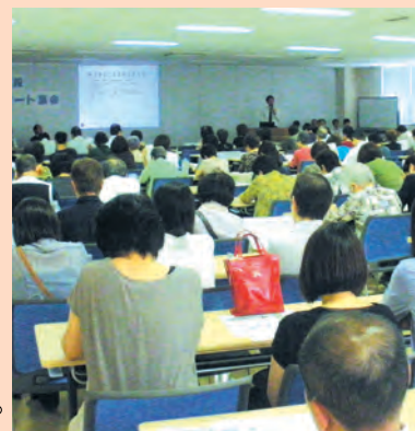
スタート集会(9月1日)

私たちの使命は、医療活動等の事業を通じて「地域で安心して住みつけられるまちづくり」を実現することです。皆様のニーズに応えるため新病院建設は「建て替えではなく、夢の実現のための新たな病院づくり」を進めていきます。