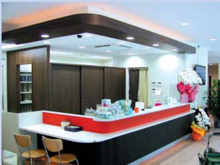
▲広くてきれいな受付と待合