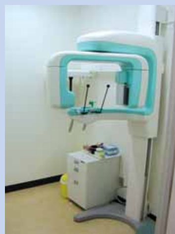
▲最新の医療機器「歯科用CT装置」