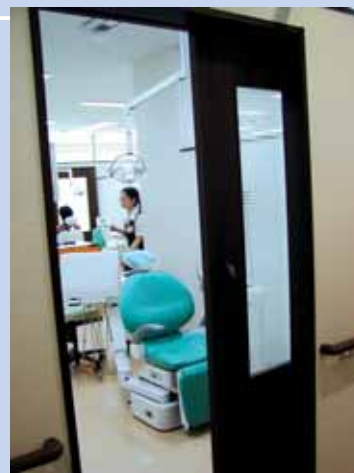
▲プライバシーに配慮した診療室