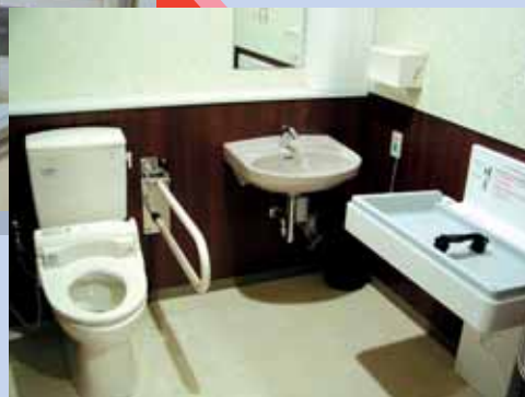
▲ベビーシートを完備した広いトイレ