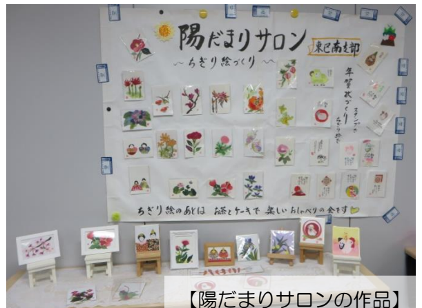
【陽だまりサロンの作品】

7本の発表ではいずれも、地域や病院・診療所・介護事業所で、医療福祉生協の理念に沿って、日ごろ